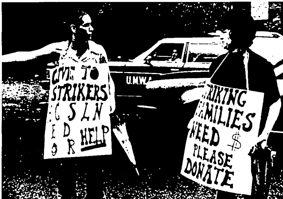
Harlan County U.S.A.. de Barbara Kopple.